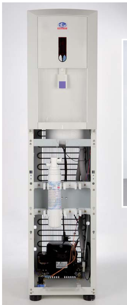
JJ170 (met AP4 filter)

Alle apparaten hebben PCB elektronische controle en LED display op het frontpaneel. Een opvangbakje