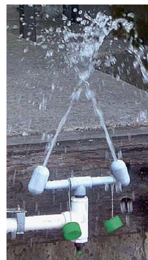
Le lave-yeux en action

utilisation. La longue poignée permet de faire un test sans être mouillé.