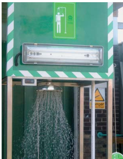
Douche munie d'une lampe fluorescente et de l'affichage de la température, en option

Les douches avec réservoir de Maestro, dont le châssis et la tuyauterie sont en inox, sont équipées d'un réservoir en Fibrotrace®, un matériau en fibre de verre recouvert d'une mousse isolante. Ces douches résistent ainsi aux intempéries et aux conditions extrêmes.