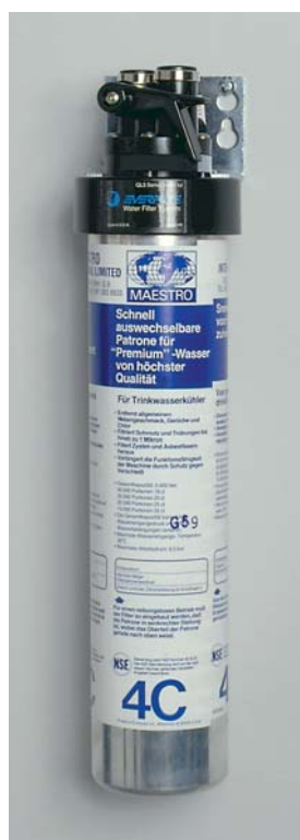
QC4 filtre à charbon actif