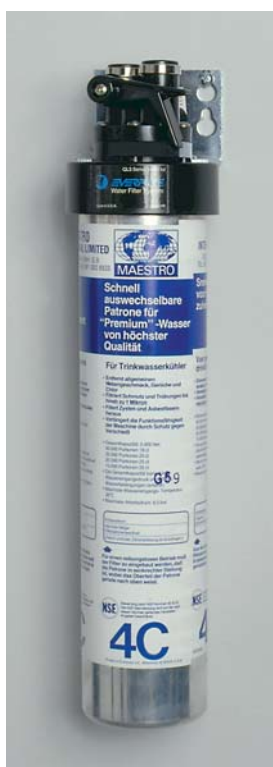
QC4 filtre à charbon actif