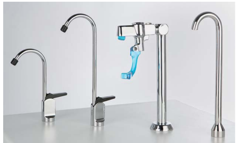
GF1 col de cygne normal