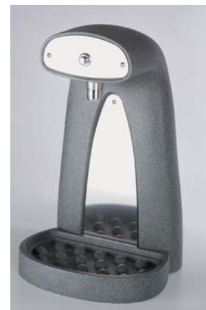
JF1 grand col de cygne

garantit une eau réfrigérée même à plusieurs mètres de la source.