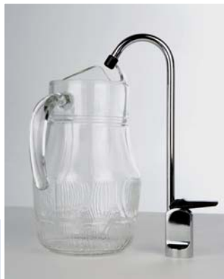
Col de cygne haut (pour carafe)