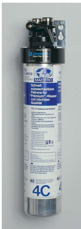
QC4 filtre à charbon actif