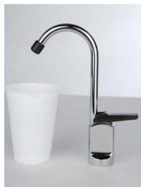
Col de cygne normal (pour gobelet)

un nombre restreint de personnes, notamment dans les bureaux. La version standard est munie d'un «bubbler», qui peut être remplacé par un col de cygne normal ou haut, moyennant un supplément modique. La taille réduite de la cuvette ne permet pas d'en installer deux.